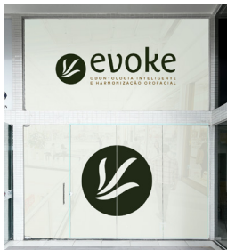
FACHADA EM ADESIVO